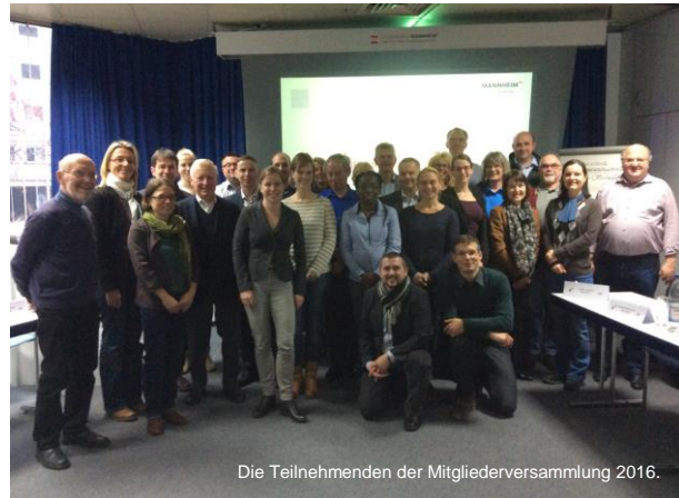
Die Teilnehmenden der Mitgliederversammlung 2016.